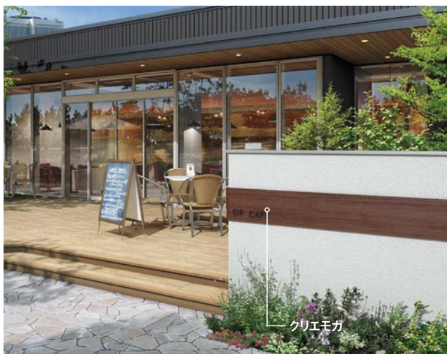
全面に貼るだけでなく、アクセントとして部分的に使うことができます。現場加工で、思いついたアイデアもその場で形にできます。