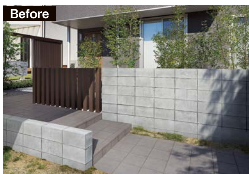
コンクリート壁に取付けできるので、時間をかけずリフォームが可能。ボード一枚で雰囲気を一変できます。