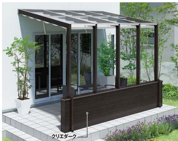
ココマの腰壁部分にデザイナーズボードを使用。本体カラーと同色のコーディネートで統一感を演出します。